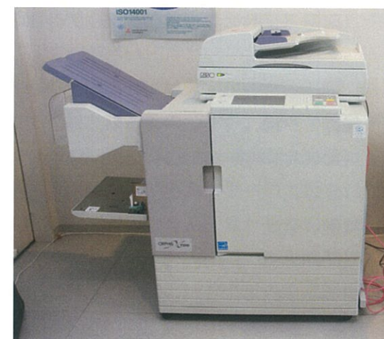
(理想科学様よりご提供いただいた「ORPHIS 7200」)